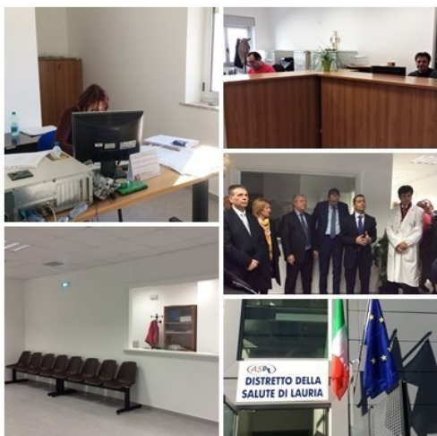
Il nuovo Distretto della Salute a Lauria inaugurato nel 2017

I cittadini, da parte loro, hanno il dovere di partecipare al miglioramento ed al buon funzionamento dei servizi sanitari, rispettando le regole stabilite e condivise.