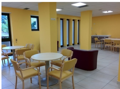
Il Centro Alzheimer a Venosa