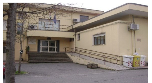
Dall'alto in basso: Distretti della Salute di Melfi, Villa d'Agri e Senise