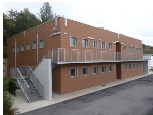
Distretto della Salute di Avigliano

L'Azienda Sanitaria Locale di Potenza, pertanto, eroga le prestazioni e i servizi dei vari livelli assistenziali attraverso le seguenti strutture.