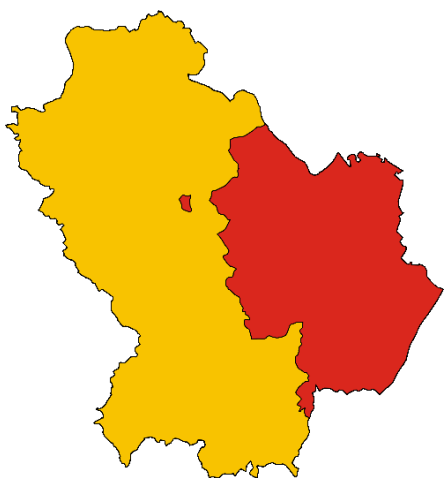
L'Azienda Sanitaria Locale ASP di Potenza (in giallo nella cartina) con sede a Potenza nasce nel 2009 accorpando le tre ex Aziende Sanitarie di Potenza, Venosa e Lagonegro