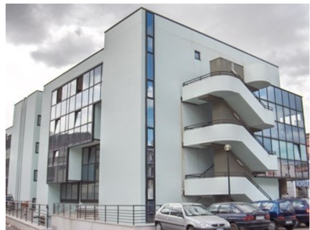
Polo Sanitario e sede del Distretto della Salute a Potenza in via del Gallitello