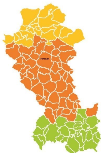
L'Azienda Sanitaria comprende 100 Comuni della Provincia di Potenza