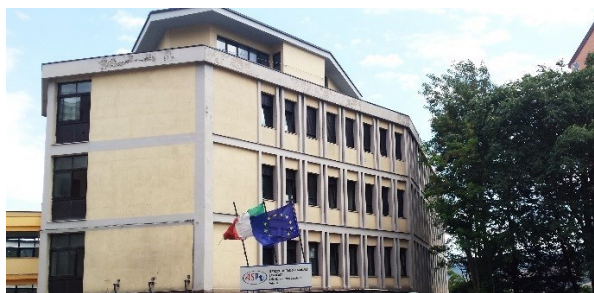
Sede Struttura Centrale Amministrativa dell'Azienda Sanitaria Locale ASP di Potenza – Via Torraca, 2 - Potenza