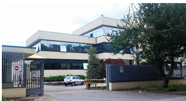
La nuova sede ASP a Potenza di Via della Fisica